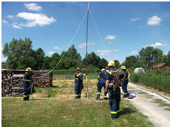
✓ 25. Juni 2017

queren, ohne dass diese beschädigt werden.