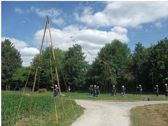
Besondere Herausforderungen ↗

Feldfernsprechern auch moderne und robuste Fernmeldetechnik, das sogenannte AWITEL, ein. Mit Hilfe von AWITEL können auch Verbindungen aus dem Drahtnetz in ein Funknetz oder in andere drahtgebundene Telekommunikationsnetze hergestellt werden.